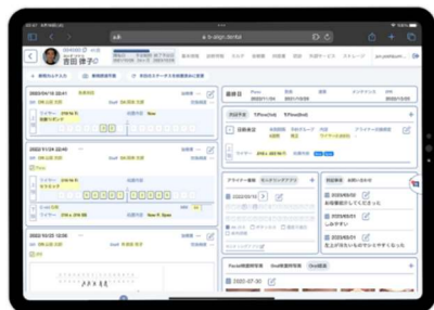
オンライン電子カルテ