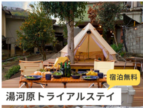
湯河原トライアルステイ