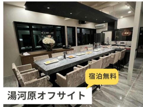
湯河原オフサイト