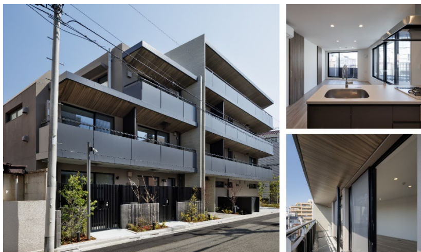
【GranDuo 荻窪3 外観・内観】

当社は、東京都杉並区上荻に、都市の利便性と穏やかな住環境の両立を図りながら、癒し効果をもたらす工夫が随所に施された自社開発物件「GranDuo（グランデュオ）荻窪3」が完成したことをお知らせいたします。