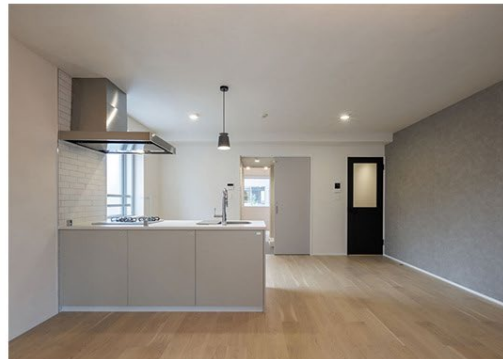
【「GranDuo 駒沢 11」外観・内観】

本物件は、東急田園都市線「駒澤大学」駅から徒歩 10 分の駒沢エリアに位置し、国内 3 大ビッグターミナルとして知られる「渋谷」へのアクセスが良好という抜群の利便性でありながら、駒沢オリンピック公園などの緑豊かな街並みに佇む物件となっています。