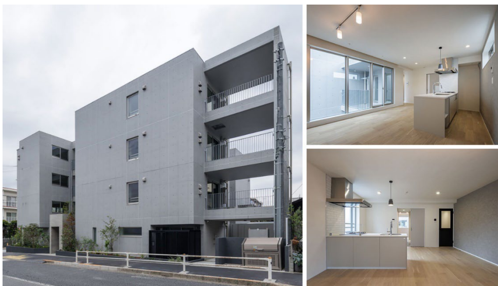
【GranDuo 駒沢 11 外観・内観】

当社は、世田谷区駒沢に、緑に囲まれた四季を感じられる自社開発物件「GranDuo（グランデュオ）駒沢 11」が完成したことをお知らせいたします。